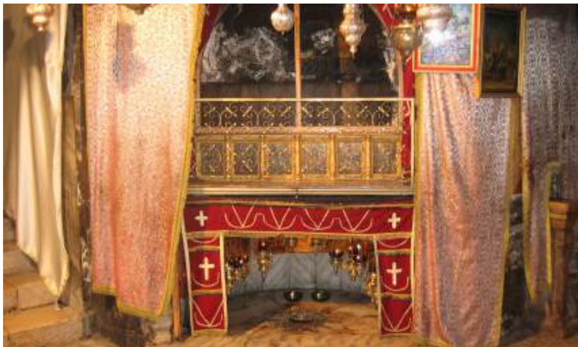
Basilica della Natività di Betlemme

me, e in qualche modo vedere con gli occhi del corpo i disagi in cui si è trovato per la mancanza delle cose necessarie a un neonato, come fu adagiato in una greppia e come giaceva sul fieno tra il bue e l'asinello». Appena l'ebbe ascoltato, il fedele amico andò subito ad approntare sul luogo designato tutto il necessario, secondo il desiderio del Santo. Il 25 dicembre giunsero a Greccio molti frati da varie parti e arrivarono anche uomini e donne dai casolari della zona, portando fiori e fiaccole per illuminare quella santa notte. Arrivato Francesco, trovò la greppia con il fieno, il bue e l'asinello. La gente accorsa manifestò una gioia indicibile, mai assaporata prima, davanti alla scena del Natale. Poi il sacerdote, sulla mangiatoia, celebrò solennemente l'Eucaristia, mostrando il legame tra l'Incarnazione del Figlio di Dio e l'Eucaristia. In quella circostanza, a Greccio, non c'erano statu-