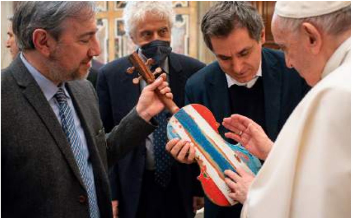
Un violino dell'Orchestra del mare

no visitato il Centro d'Ascolto dell'Incoronata e il magazzino con vestiti e viveri per tutti coloro che si rivolgono allo sportello. Accompagnati dai volontari, i bambini e le bambine hanno potuto toccare con mano la solidarietà che giorno dopo giorno si manifesta nei confronti delle famiglie bisognose del territorio. La carità non è cosa straordina-