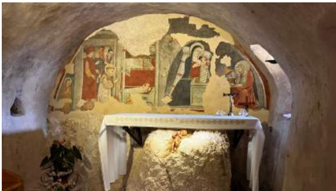
Il presepe di Greccio