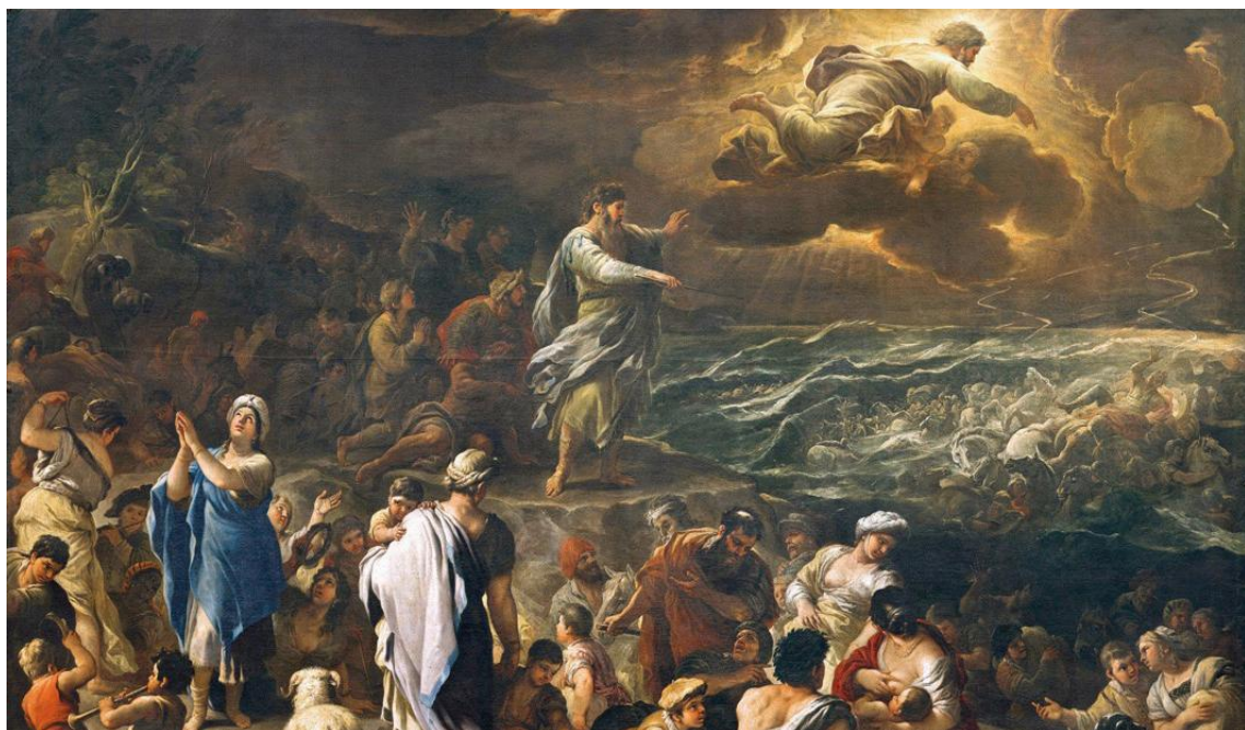
Passaggio del Mar Rosso, Giordano

diventano centri di missione, e quindi poi anche nuclei di aggregazione delle comunità cristiane locali. La nascita delle chiese dai monasteri – o rispettivamente la rinascita delle chiese a procedere dai monasteri – corrisponde, sotto cero profilo, al disegno originario di Benedetto. Pur cristiano dalla nascita, egli era fuggito dalla città di Roma spaventato dalla sua corruzione. La descrizione della vita monastica come scuola di vita cristiana, e dunque del servizio del Signore, e come scuola “elementare”, è sottesa dall'assunto che, a meno di tanto, una vita cristiana non sarebbe possibile. Il progetto di Benedetto assomiglia, sotto questo profilo, a quello di Basilio; le sue regole non intendevano definire un progetto di vita “di speciale consacrazione”; intendevano definire le regole generali della vita cristiana, che non potevano essere quelle della vita civile corrente. A fronte