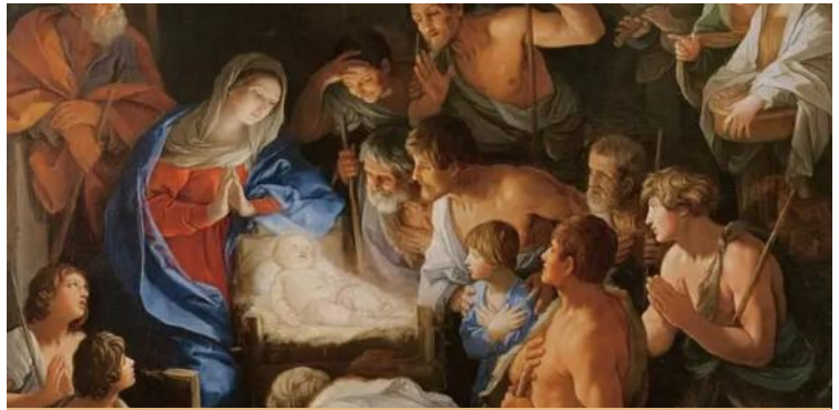
L'adorazione dei pastori, Guido Reni

viene meno la gioia del Natale che si offre con il suo carico di speranza e di stimolo a non rinunciare mai alla vita. La gioia del Natale infatti non è legata solo a un avvenimento del passato, ma ripropone la vicinanza di Dio qui e ora, nel nostro oggi di salvezza. Il Figlio di Dio che si fa figlio dell’uomo apre e stimola sempre a rinnovare i nostri legami di fraternità e a crearne di nuovi, prendendoci carico delle persone nel mondo in cui viviamo, come continua a ricordarci papa Francesco. Così, la benedizione che veniamo a portare si inserisce bene nel cammino di Avvento, nell’invocazione della venuta del Signore, nella ricerca dei segni della sua presenza, nella implorazione della sua misericordia, nella domanda del coraggio di essere sempre e, in particolare oggi, operatori di pace e costruttori del bene. A tutti offriremo un’immagine natalizia con una preghiera di benedizione. Abbiamo scelto un brano della preghiera del Papa per il prossimo Giubileo. La proposta è che questa preghiera sia recitata insieme nella propria casa, in particolare nel giorno di Natale, e che uno dei membri benedica tutta la famiglia. Invitiamo le persone più sensibili a portare questa immagine anche ai vicini e agli amici, come se-