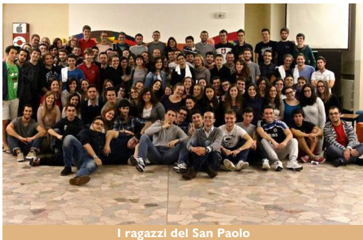
I ragazzi del San Paolo