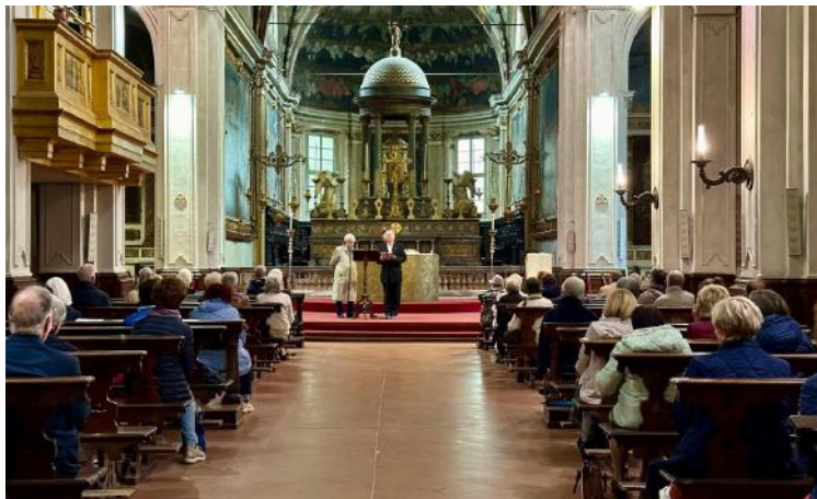
La chiesa di San Marco

10. Gli anziani sono felici di stare insieme, di farsi compagnia e di sperimentare che godendo della considerazione reciproca fanno a gara nel rendere possibile il germinare di fiducia (che viene da dentro) e speranza (la progettualità) per la comunità intera, anche per chi oggi non si vede e magari mai si incontrerà, spes contra spem . Gli anziani sono fattori di cura della città quand'è malata.