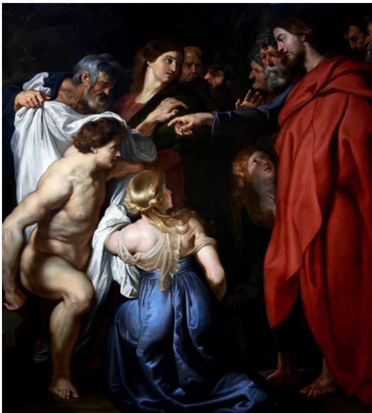
La resurrezione di Lazzaro, Rubens

re in sogno chi ci ha lasciato. Eppure siamo felici di poter dire: Sai, ho sognato, la nostra mamma mi ha parlato. Ma è solo un sogno. E invece Gesù afferma: la mia voce entra nel regno dei morti, rompe l'isolamento, infrange il silenzio: «I morti udranno la voce del Figlio di Dio...» . Mentre le nostre parole tentano disperatamente di destare chi si è addormentato nel sonno della morte ma non ricevono alcuna risposta se non il silenzio, la voce del Figlio di Dio raggiunge i morti e li ridesta. Questa voce ha ridestato Lazzaro, già da quattro giorni nel sepolcro. Ha ridestato il giovane figlio della Vedova di Nain, la giovane figlia di Giairo capo della Sinagoga. Questa stessa voce raggiungerà i nostri orec-