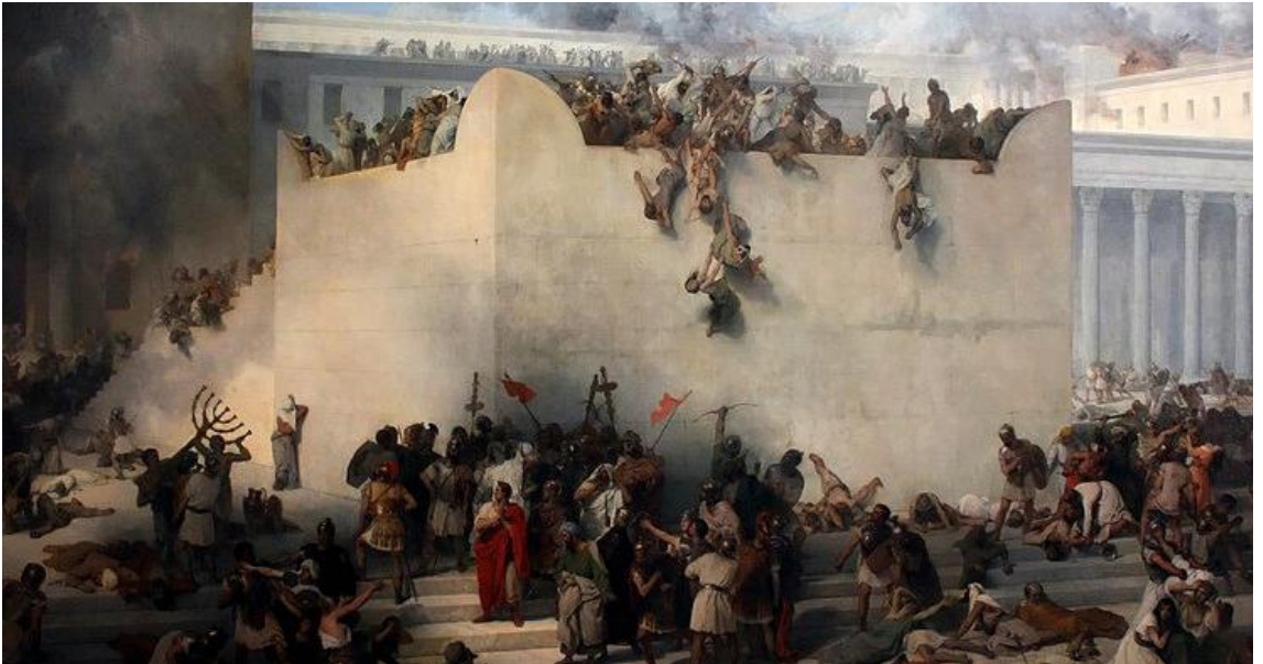
La distruzione del Tempio, Hayez

scepoli; conoscerete la verità e la verità vi farà liberi» (Gv 8,31s). Rimanere fedeli alla parola vuol dire praticarla. Essi presumono d'essere già liberi; ma non si accede alla libertà se non passando attraverso la confessione della schiavitù precedente. Il salterio è soprattutto questo, la confessione di una condizione di schiavitù, e cioè di una scarsità della vita che appare un impedimento scoraggiante alla libertà: «Perché quasi un nulla hai creato ogni uomo? Quale vivente non vedrà la morte, sfuggirà al potere degli inferi?» (Sal 88,48s). Appunto l'angoscia accende il grido della preghiera, e la strada della libertà. Alla scarsità della vita si cerca rimedio attraverso il grido a Lui rivolto. Il grido costringe a rinnovare l'obbedienza a Lui; e anzi tutto la confessione della colpa, del timore di essere in colpa. Il grido di angoscia, la confessione della colpa e l'invocazione del perdono sono i contenuti essenziali dei salmi di lamento, e quindi anche del salterio tutto trasformato in una