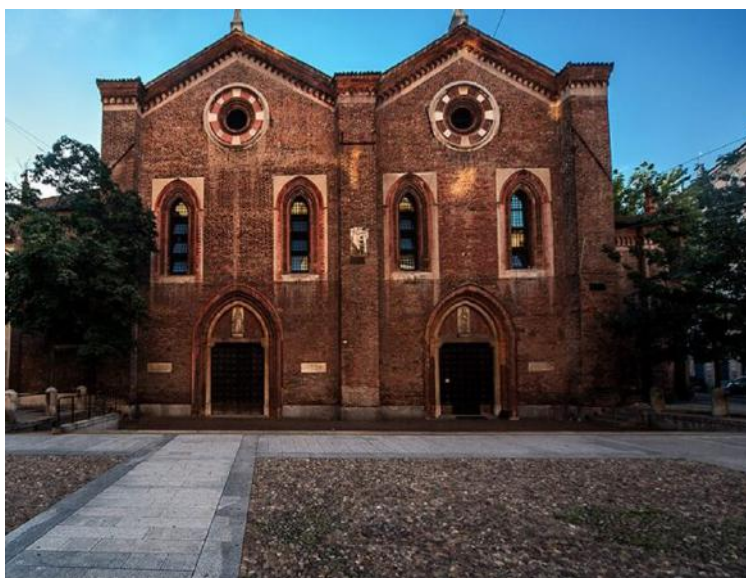
Chiesa di Santa Maria Incoronata