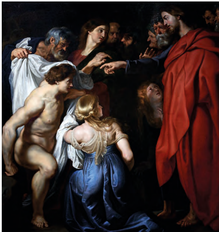
La resurrezione di Lazzaro, Rubens

il suo stato d'animo in occasione della morte di un amico carissimo: «L'angoscia avviluppò di tenebre il mio cuore: ogni oggetto su cui posavo lo sguardo era morte. Era per me un tormento la mia città, la casa paterna un'infelicità straordinaria. Tutte le cose che avevo avuto in comune con lui, la sua assenza aveva trasformate in uno strazio immane. I miei occhi lo cercavano dovunque senza incontrarlo, odiavo il mondo intero perché non lo possedeva e non poteva più dirmi: "Ecco verrà, come durante le sue assenze da vivo". Io stesso ero diventato per me un grande interrogativo». Di fronte alla morte, con la voce rotta dal pianto, Gesù ci domanda: Credi tu? Ma che cosa vuol dire "credere" quando si è dinanzi alla morte? Se credi in me, se a me ti affidi, nulla ti