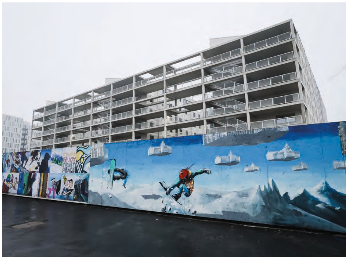
Uno scorcio del Villaggio Olimpico in zona Porta Romana