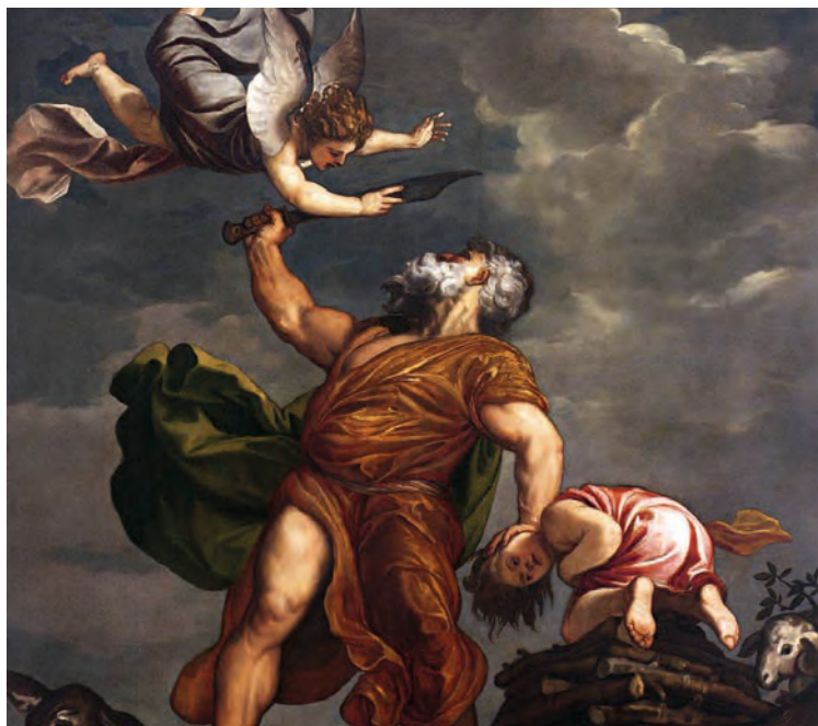
Il sacrificio di Isacco, Tiziano

strema tentazione di schiodarsi dal legno della croce per sottrarsi alla morte smentendo la sua stessa parola: «Nessuno ha un amore più grande di questo: dare la vita per i propri amici» (Gv 15,13).