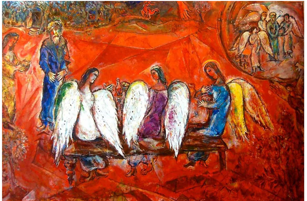
Marc Chagall, Abramo e i tre angeli , 1935, Nizza.

«Guardiamo il cielo. Contemplando dopo millenni lo stesso cielo, appaiono le medesime stelle. Esse illuminano le notti più scure perché brillano insieme. Il cielo ci dona così un messaggio di unità: l'Altissimo sopra di noi ci invita a non separarci mai dal fratello che sta accanto a