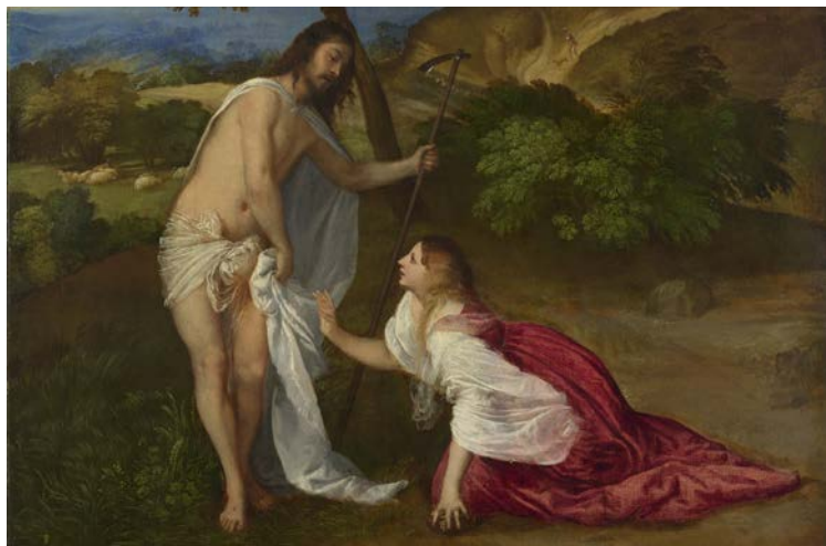
Noli me tangere, Tiziano

fronte ad alcuni segnali del Risorto, non ebbero la forza di aspettare lo sviluppo degli eventi e se ne andarono da Gerusalemme. Noi ti preghiamo, o Madre della speranza e della pazienza: chiedi al tuo Figlio che abbia misericordia di noi e ci venga a cercare sulla strada delle nostre fughe e impazienze, come ha fatto con i discepoli di Emmaus, chiedi che ancora una volta la sua parola riscaldi il nostro cuore. Intercedi per noi affinché viviamo nel tempo con la speranza dell'eternità, con la certezza che il disegno di Dio sul mondo si compirà a suo tempo e noi potremo contemplare con gioia la gloria del Risorto, gloria che già è presente, pur se in maniera velata, nel mistero della storia. Tu, o Maria, sei Madre del dolore, tu sei colei che non cessa di amare Dio nonostante la sua apparente assenza, e in Lui non si stanca di amare i suoi figli, custodendoli nel silenzio dell'attesa. Nel tuo Sabato santo, o Maria, ottienici quella consolazione profonda che ci permette di amare anche nella notte della fede e della speranza e quando ci sembra di non vedere neppure più il volto del fratello!>