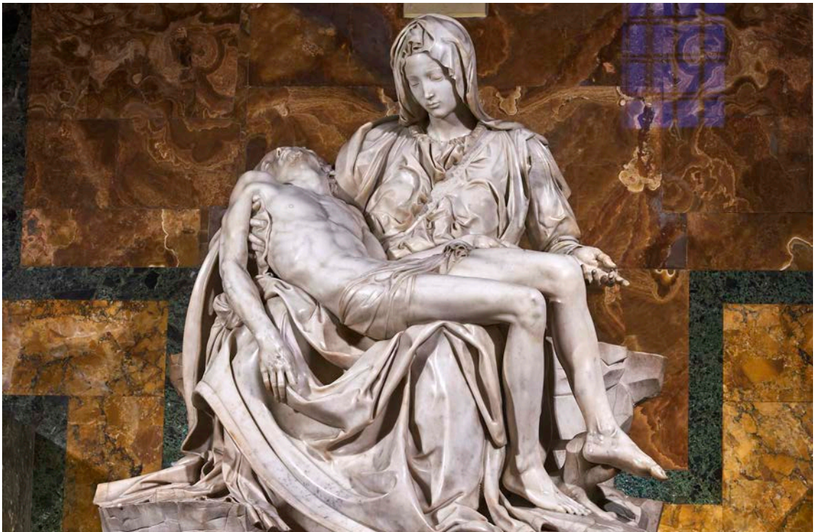
La Pietà, Michelangelo

Questo secondo giorno è giorno di silenzio. L'altare è spoglio senza Celebrazione Eucaristica. La Chiesa ci invita a leggere la pagina del diluvio e il maldestro tentativo di sigillare il sepolcro vigilato da guardie per sventare il tentativo dei discepoli di trafugare il corpo di Gesù e poi dichiarare la risurrezione. A questo giorno apparentemente vuoto eppure carico di attesa ha dedicato una stupenda e sorprendente lettera pastorale 2000/2001 il cardinale Carlo Maria Martini, la Madonna del Sabato Santo : «O Maria, hai imparato ad attendere e a sperare. Hai atteso con fiducia la nascita del tuo Figlio proclamata dall'angelo, ha perseverato nel credere alla parola di Gabriele anche nei tempi lunghi in cui non capitava niente, hai sperato contro ogni speranza