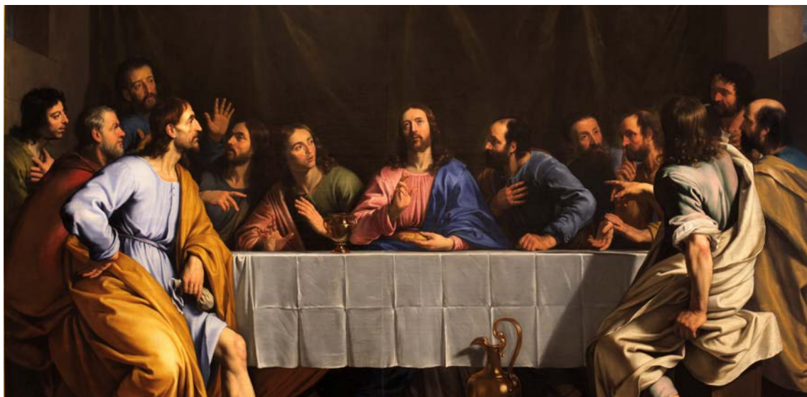
L'Ultima cena, Philippe de Champaigne

la risposta è semplice e sorprendente. La tavola dice il desiderio di Dio di incontrarci a tavola, perchè tutti siamo suoi amici. La tavola è una fessura da cui spiare Dio. La tavola dell'altare sì, ma anche le nostre tavole di casa, da rispettare e custodire come svelamento di una presenza che ci sfiora, proprio alla tavola. Anche le nostre tavole che troppe volte vedono un prender cibo frettoloso, veloce, senza sguardi che si incontrano, senza parole. Quante volte Gesù ha raccontato Dio con il suo trovarsi a tavola, a tavola con tutti. E con una preferenza che gli veniva rimproverata, a tavola con i peccatori. La tavola è stata per Gesù luogo privilegiato,