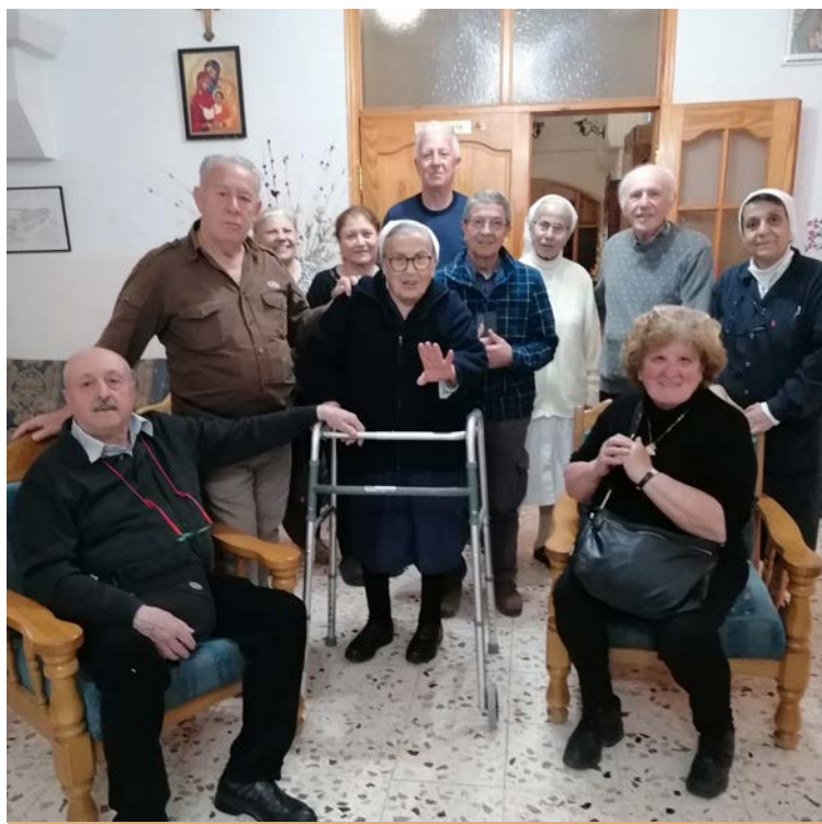
Le Suore di Betania