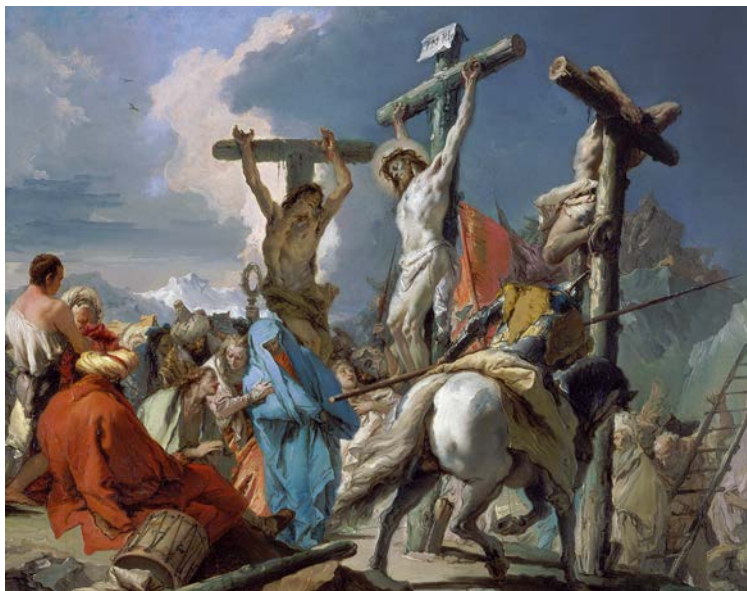
La Crocifissione, Tiepolo

parole di Gesù morente. Solo una di queste è riportata da Matteo e l'ascolteremo questo Venerdì santo; è forse la più terribile e inquietante: «Eli, Eli lema sabactani – Dio mio, Dio mio perché mi hai abbandonato?» È un grido emesso a gran voce, che l'evangelista riporta in aramaico, la lingua usata da Gesù. Non è un grido di disperazione rivolto a un cielo chiuso e ostile, a un destino cieco e assurdo, questo grido è rivolto a Dio, anzi al suo Dio, «Dio mio, Dio mio». Questo grido è una preghiera. Non una preghiera devota, serena, pacificante. È una preghiera che è come una lotta perché Gesù vive in quel pomeriggio l'essere senza Dio, il soffrire e il patire senza Dio, fino a morire. Questa parola esprime la terribile realtà della morte, esperienza di solitudine e abbandono. Nessuno di noi ha mai provato questa esperienza eppure credo che tutti noi abbiamo fatto quella dura e insieme consolante esperienza che è l'accompagnare qualcuno nella malattia e nell'agonia.