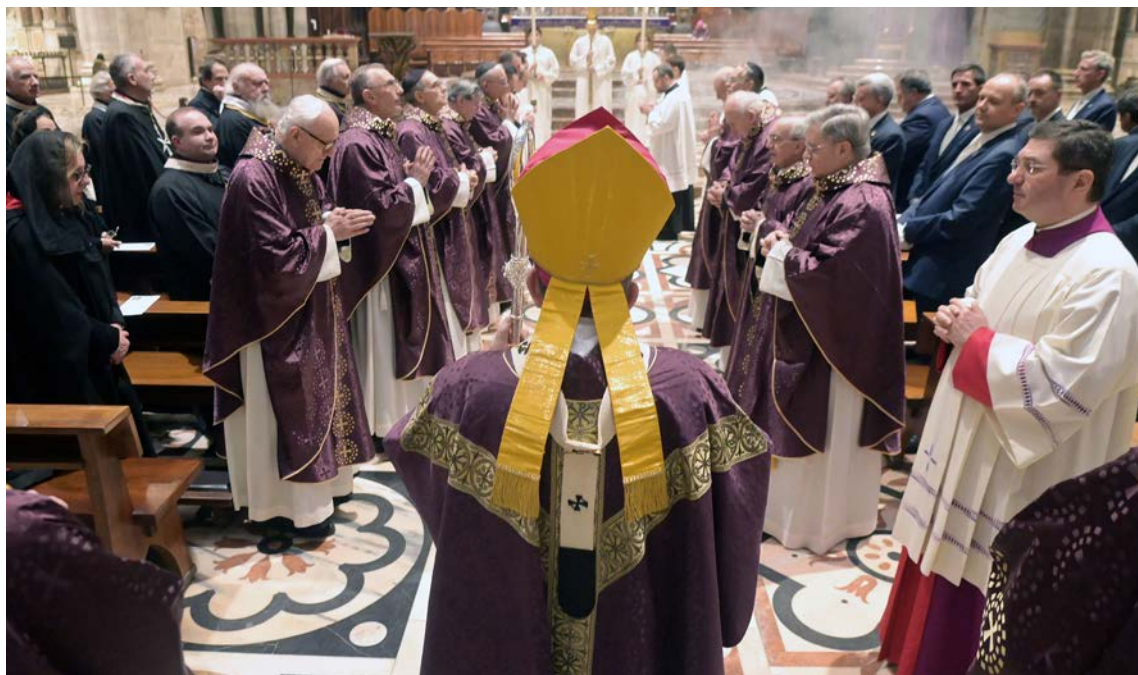
S. Messa nella I domenica di Quaresima

gia del tempo di Quaresima è di grande ricchezza. Le domeniche offrono pagine di Vangelo straordinarie e bellissime. Anche la Parola di Dio dei giorni feriali è di singolare intensità: leggere insieme il discorso della montagna del Vangelo di Matteo (capitoli 5 – 7) è sentire Gesù che interpella direttamente ciascuno e rivela la verità dello stile buono di relazioni tra noi e con Dio. Il senso della “penitenza” quaresimale, che si esprime anche nella forma della sobrietà e del digiuno, è quello di un cammino che ci liberi dalle tante forme di dipendenza di cui ci troviamo vittime. Per noi sembra quasi naturale “sprecare” tante cose, dal cibo ai vestiti a tanto altro, ma è giusto? Lo spreco è un cedere alla logica del consumismo che dimentica la povertà di tante persone, i tanti bisogni di cui soffrono anche persone vicino a noi. Convertirsi