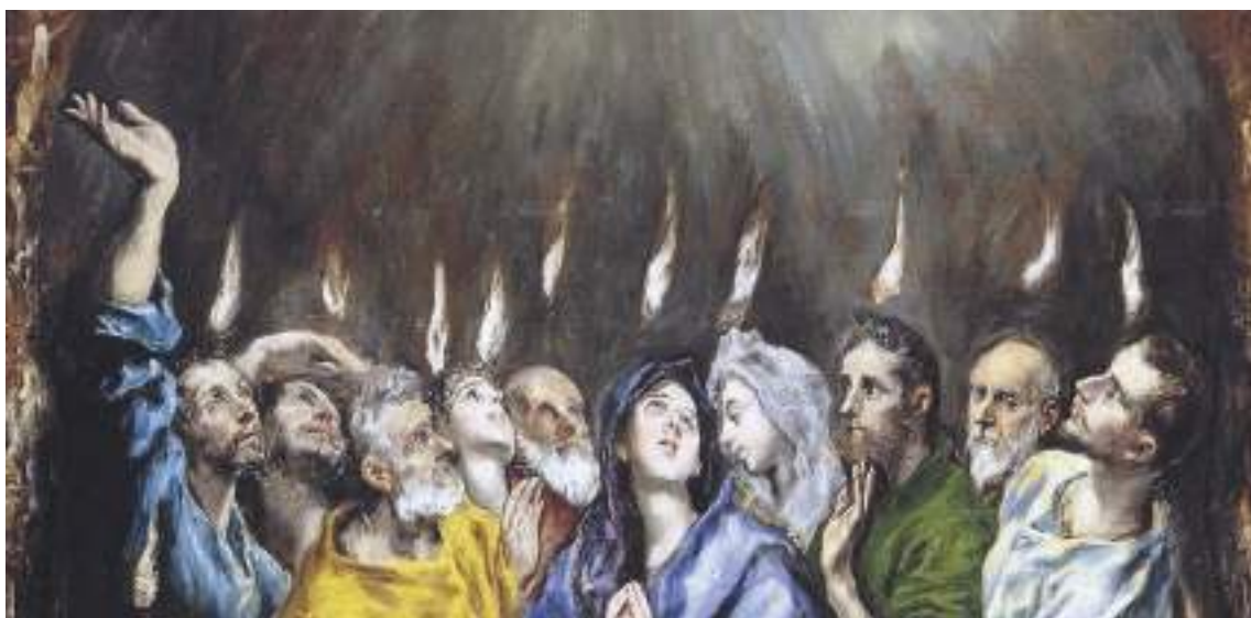
Pentecoste, El Greco

I discepoli che nell'ora della cattura di Gesù erano fuggiti, e nessuno di loro a eccezione di Giovanni, aveva avuto coraggio per stare sotto la