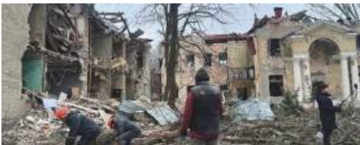
Guerra in Ucraina (Caritas International)

Anche in Ucraina esiste una lettura ideologica del con-