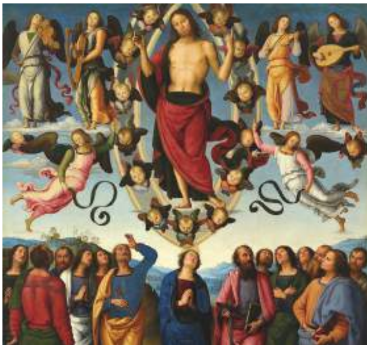
L'Ascensione di Cristo, Perugino

Ascende solo colui che è disceso Davvero sobrio il racconto della A-