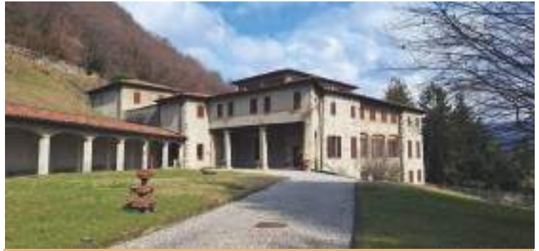
L'Eremo di San Salvatore

Marco all'Eremo, andata e ritorno. Con la conferma indicate: nome, cognome, indirizzo, telefono cellulare, mail e se si arriverà all'Eremo con mezzi propri (ed eventuali posti nella propria auto da mettere a disposizione di altri partecipanti) o con il bus che predisporremo. Info e iscrizioni: don Giuseppe Grampa (giuseppegrampa@libero.it – 338.6565618).