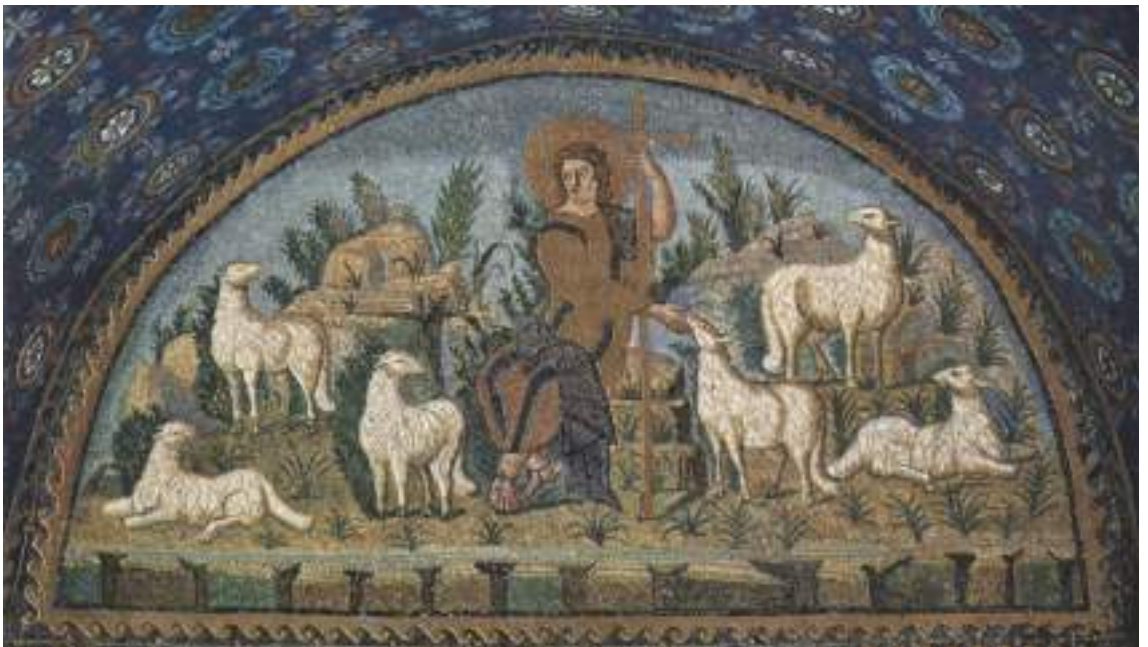
Il Buon Pastore, Mausoleo Galla Placidia

Il tempo non è vuoto ma abitato dallo Spirito di Gesù