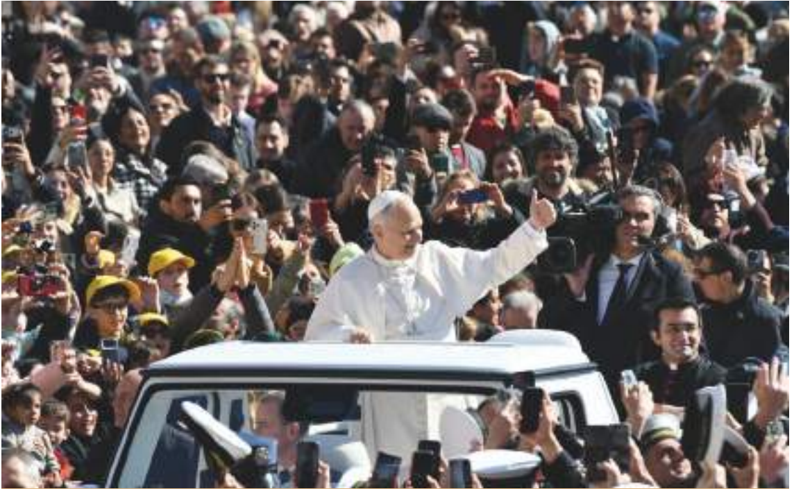
Papa Leone XIV in San Pietro

“accanto” alle tante altre parole. La Parola di Dio è rivelazione della comunione di Dio; è indirizzo del cammino dei nostri giorni; è promessa di vita. Ma per ascoltare la Parola di Dio occorre silenzio. È saggio colui che nella sua giornata sa programmare un tempo di silenzio nel quale riconoscere la presenza del Signore, ascoltarlo, dialogare con Lui, sentirsi stimolare a essere attori di una storia di libertà segnata dalla verità dell'essere figli di Dio e Fratelli di tutti.