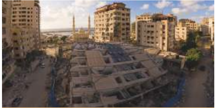
Gaza bombardata

Generalmente nei giorni in cui sono a casa, cerco – insieme ai miei colleghi – di incontrare più persone e più gruppi possibili, sia giovani che meno giovani. Cinque giorni