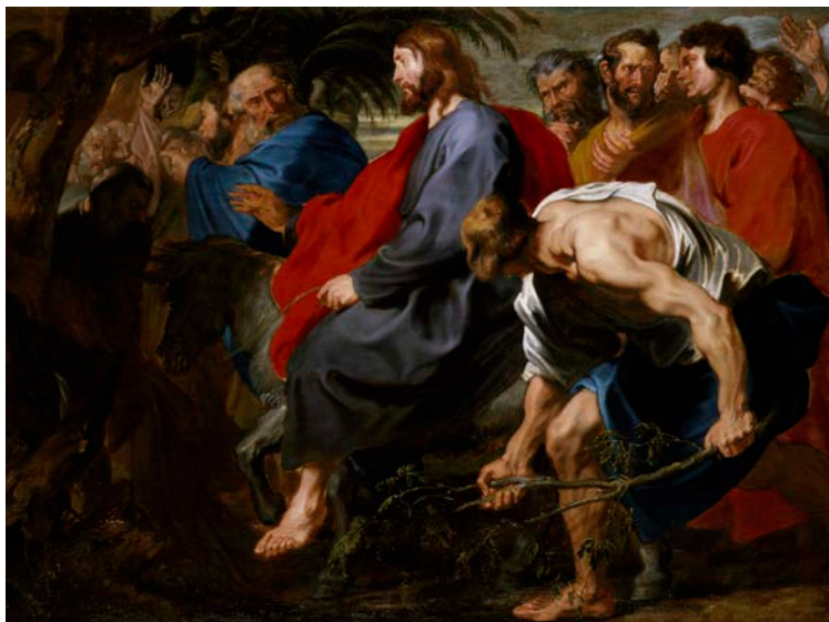
Entrata di Cristo a Gerusalemme, A. van Dyck

Il simbolo della strada non solo dice chi è Gesù, qualifica anche i discepoli. È sulla strada, camminando verso Emmaus che Gesù aprirà il cuore di due discepoli rassegnati per la morte di Gesù e per la fine dell'esaltante avventura vissuta con Lui. Nel libro degli Atti degli Apostoli i primi discepoli di Gesù vengono ripetutamente indicati come gli uomini e le donne della strada. Vi leggiamo infatti che Saulo è inviato a Damasco perché arresti e porti in catene a Gerusalemme tutti quelli che avesse trovato, uomini e donne appartenenti a questa strada (At 9,2). Ancora, a Efeso Apollo, «Uomo colto, esperto nelle Scritture era stato istruito nella strada del Signore e con animo ispirato parlava e insegnava con accuratezza ciò che