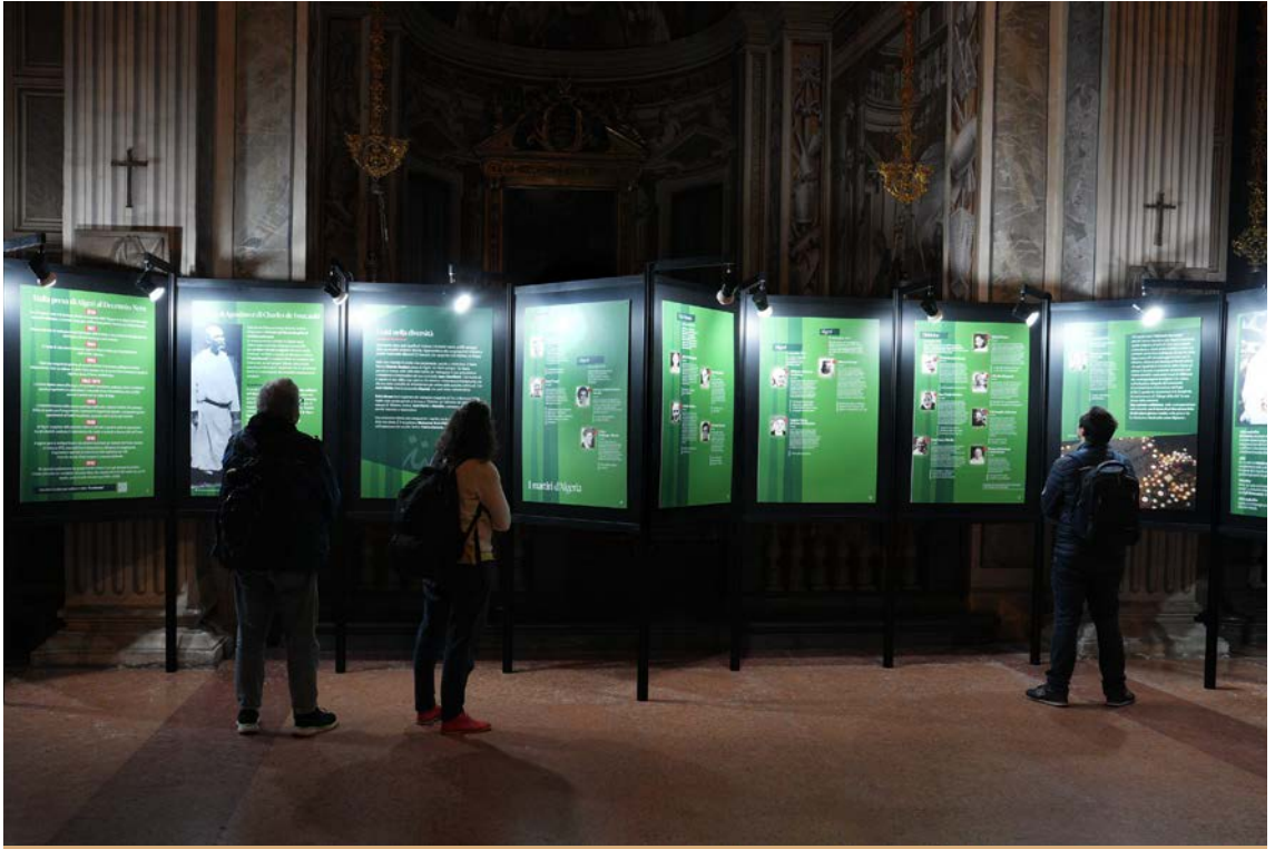
Inaugurazione della mostra Chiamati due volte

lata Chiamati due volte , ha come primo scopo quello di mostrarci il coraggio di fratelli e sorelle che hanno saputo vivere il Vangelo in ambienti e in situazioni difficilissime fino a donare la vita nel martirio, vivendo con piena disponibilità e fedeltà la loro vocazione. Questi fratelli e queste sorelle non hanno cercato il martirio. Si sono interrogati, insieme, nella preghiera, condividendo anche apprensioni, paure, anche dubbi. Poi si sono donati, continuando a servire i poveri che facevano conto sulla loro presenza. Perché erano un concretissimo segno di speranza per loro. “Sono stati chiamati due volte” perché hanno risposto a una doppia vocazione: quella religiosa, propria di ciascuno, e quella comunitaria a vivere la loro fedeltà a Cristo nel