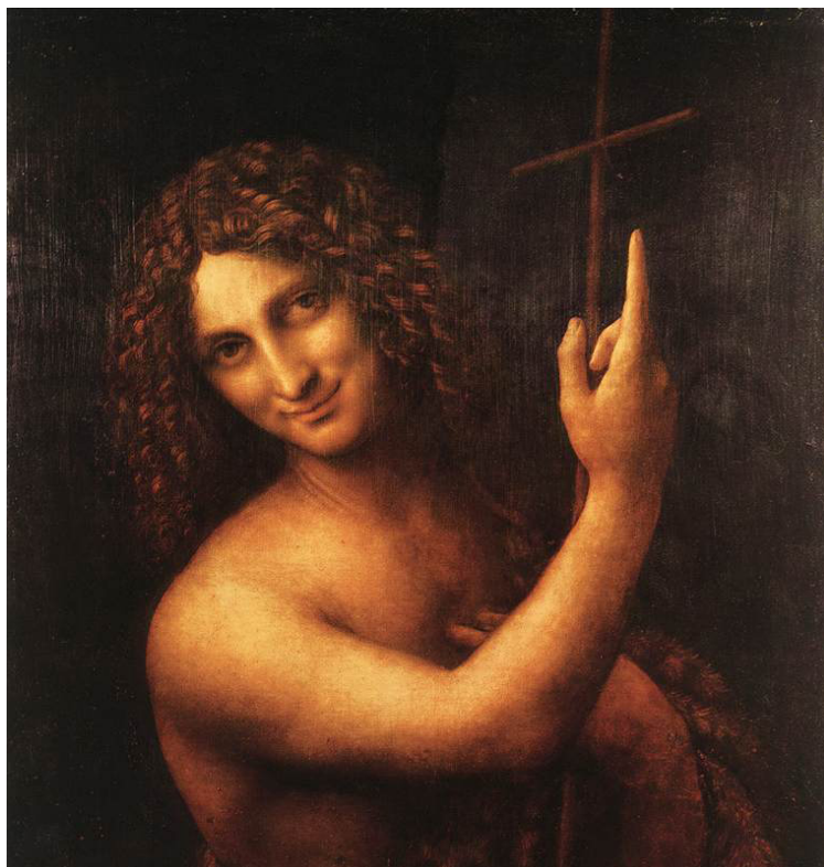
San Giovanni Battista, Leonardo da Vinci