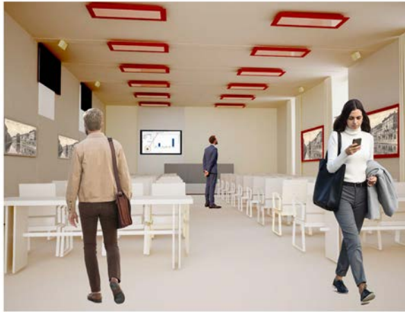
La nuova aula al secondo piano