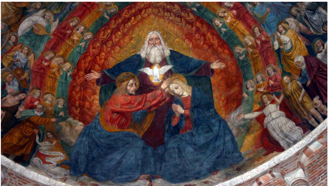
Incoronazione di Maria, Bergognone, San Simpliciano Milano

nostro esistere. Camminare vuol dire perseveranza: un passo dopo l'altro senza cedimenti. Anche il cammino della fede conosce la fatica di fare un passo dopo l'altro. Proprio nel Vangelo di Giovanni la fede, il credere è talvolta sostituito con l'espressione "venire a Gesù", camminare verso Gesù. La fede, allora, proprio perché è strada, non può essere scorciatoia che ci esoneri dalla fatica paziente, non è espediente che ci liberi, d'un balzo, dalle difficoltà. Venire alla fede è sempre cammino, talora lungo quanto una vita, fatto di tanti passi, cammino che può conoscere con la gioia della scoperta, anche il bisogno di soste, ripensamenti, momenti di stanchezza, tentazioni di rinuncia. Ogni cammino è fatto di tanti passi tutti necessari per arrivare alla mèta. Così anche la fede: tanti passi, tanti frammenti, tante piccole e grandi scoperte verso Colui che è la pienezza della verità.