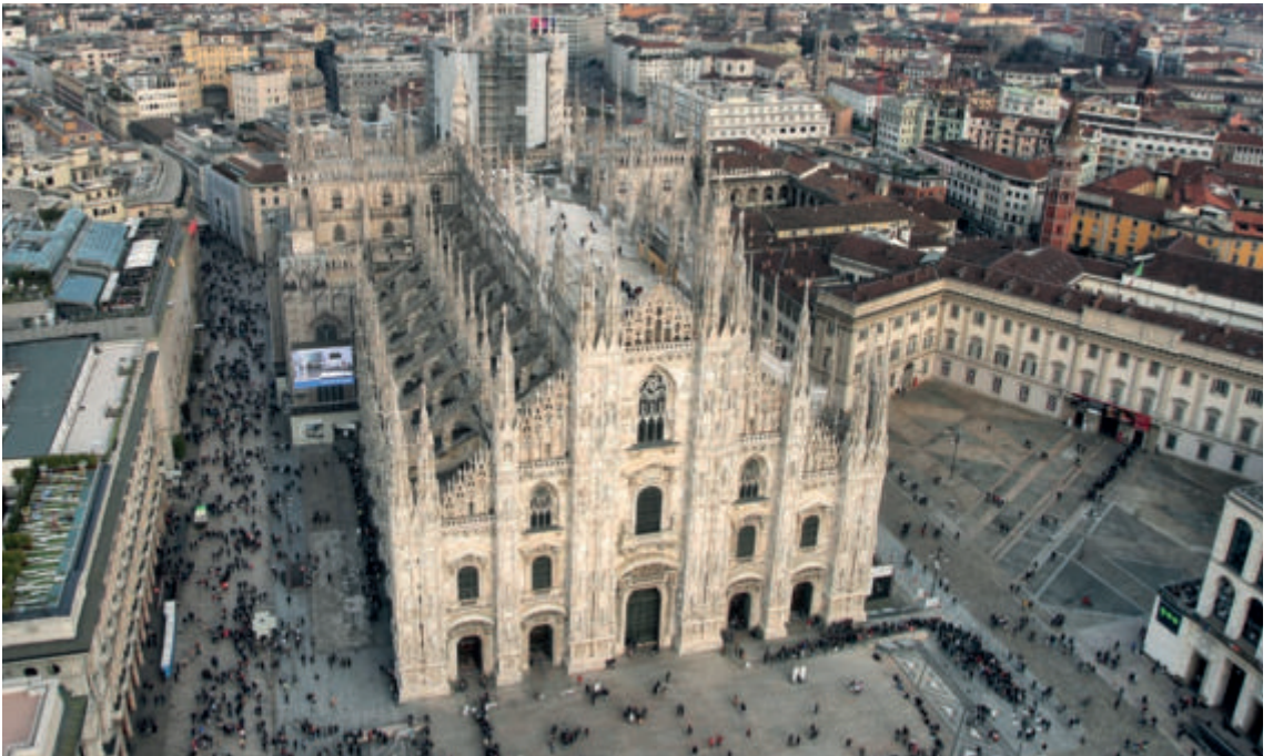
Il Duomo di Milano