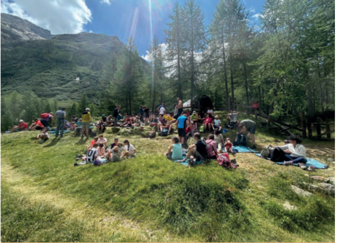
Campeggi estivi

cabili conversazioni rinsaldano in quelle sere estive legami di vecchia data che nel corso dell'anno non trovano spazio». Per coloro che vivranno le vacanze in famiglia, saranno occasione preziosa per stringere più forte i legami in un tempo disteso nel quale ascoltarsi, conversare su ciò che più sta a cuore, creare attività da condividere. Un tempo nel quale manifestare più serenamente quanto ci si vuole bene. Nella Lettera dei cresimandi ai genitori e alla comunità, i nostri giovani amici, tra le altre cose, hanno scritto: «Vorremmo leggere con voi il Vangelo, entrare in chiesa anche in vacanza, accendere una candelina e tenerci per mano mentre parliamo al Si-