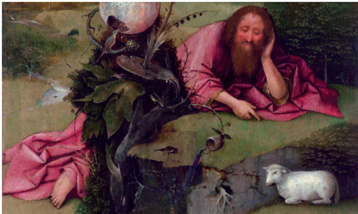
San Giovanni Battista in meditazione di H. Bosch

Anche la Chiesa e le sue varie comunità possono incorrere nella sottile tentazione di mettersi al centro dell'attenzione, con le loro strutture, il loro peso organizzativo. E invece devono essere segno che potentemente ed efficacemente indica Gesù. Come Giovanni anche la Chiesa non ha altra ragion d'essere che diminuire perché Lui solo cresca. Leggendo i Vangeli scopriamo che Giovanni avrebbe potuto sfruttare a suo vantaggio il grande fascino che la sua persona esercitava sulla gente. E invece a chi gli domanda: Sei il Cristo? Cioè l'unto del Signore, il suo Inviato, oppure sei Elia o il profeta, risponde con disarmante semplicità: «lo sono voce, solo voce che nemmeno dice parole sue ma riprende antichi annunci del profeta Isaia: Rendete diritta la via del Signore» . E insiste nel dichiarare che vi è un