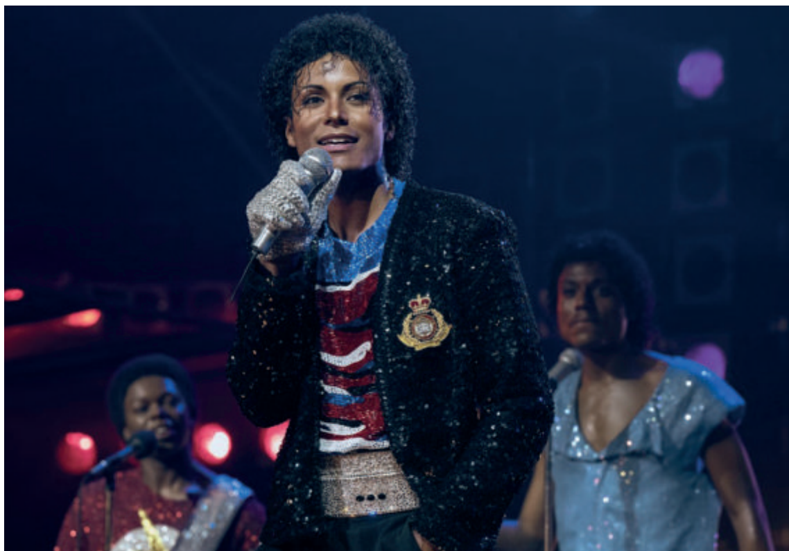
Un'immagine del film