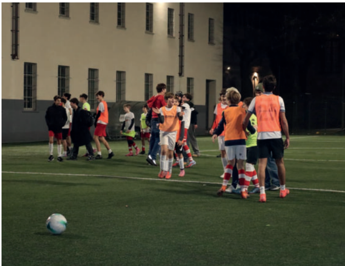
Scuola Calcio San Simpliciano