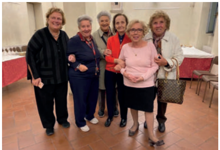
Le volontarie del Centro Caritas

A tutte queste persone viene offerto uno spazio caldo, una doccia, cure mediche di base e informazioni. Fondazione Somaschi è sempre aperta e i servizi sempre attivi, anche nei mesi di luglio e agosto. Il drop-in chiude dal 13 al 21 agosto. Il servizio WEMI invece è chiuso dal 3 al 10 agosto. Per maggiori dettagli consultare il sito www.fondazioneSomaschi.it .