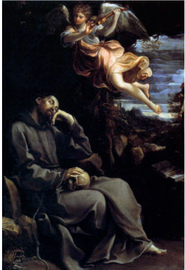
San Francesco confortato da un angelo musicante, Guido Reni

Cesare Vaiani, Spiritualità fraterna. Una Vita di san Francesco tra storia e teologia , Edizioni Biblioteca Francescana, Milano 2022