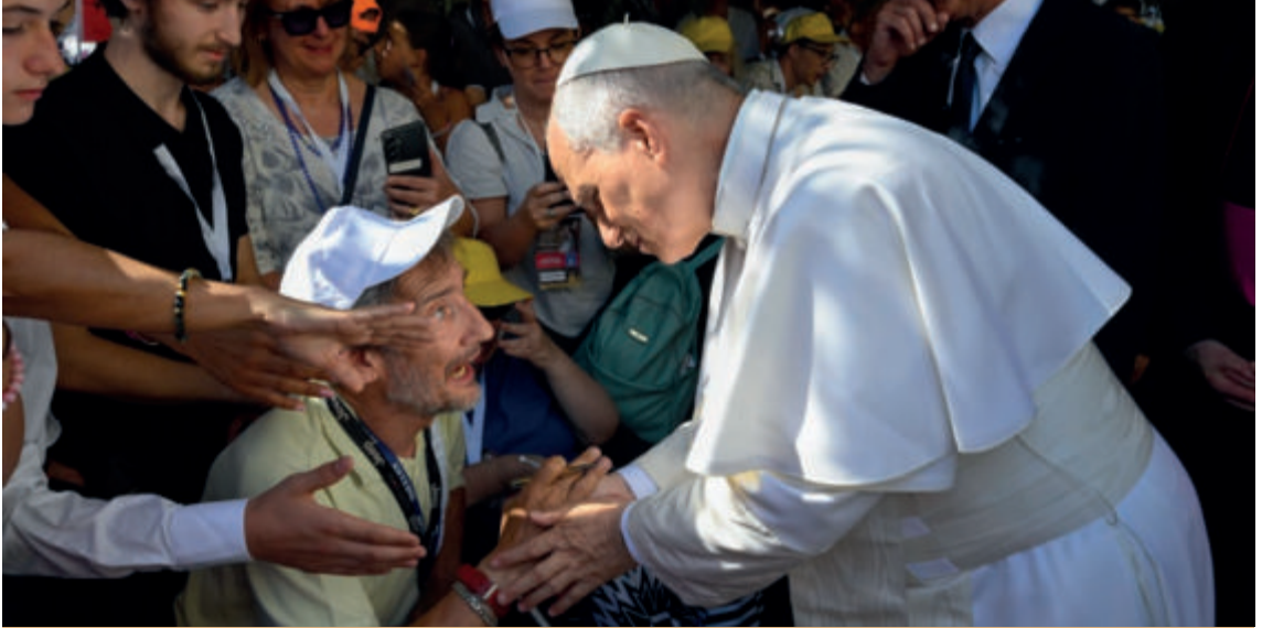
Leone XIV a Pavia

ne riprende questo insegnamento conciliare con una formula efficace: «La storia è perciò uno dei luoghi in cui la Chiesa si lascia istruire dallo Spirito sulla portata umanizzante del Vangelo e impara a declinare il proprio insegnamento a servizio della dignità di ogni persona e del bene dei popoli» (n.23). La Dottrina sociale della Chiesa occupa anche il secondo capitolo della Lettera presentandone i fondamenti e i principi. Questa distinzione è importante: i fondamenti si raccolgono in una sola parola: dignità. Muovendo dalla prima pagina della Scrittura Sacra Leone pone il fondamento della “magnifica umanità” nel gesto creatore che vuole l’essere umano immagine somigliantissima del Creatore. Qui sta la dignità che non può esser negoziata, è inalienabile. Oggi si parla di “qualità della vita” di quell’insieme di condizioni che rendono la vita degna d’esser vissuta. Mettendo accento sulla dignità della vita Leone ci ricorda che anche in assenza di talune qualità ogni vita umana è dota-